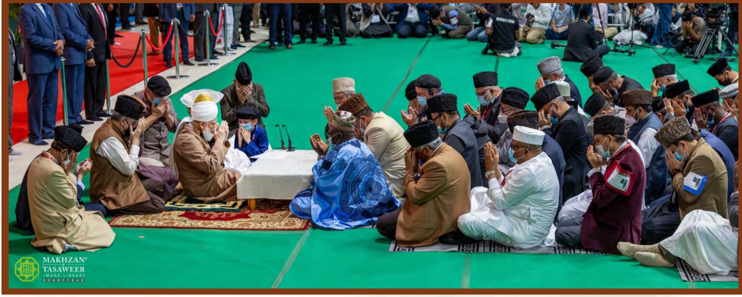
59వ జల్సా సాలాన యు.కే సందర్భములో తేది 27 జూలై 2025న అంతర్జాతీయ బైఅత్ యొక్క విశ్వాసభరిత దృశ్యం. 111 దేశాలకు చెందిన 500 జాతుల నుండి 2,44,408 మంది అభిమానపు హారంలో ఇమడ్చబడిన దృశ్యం.