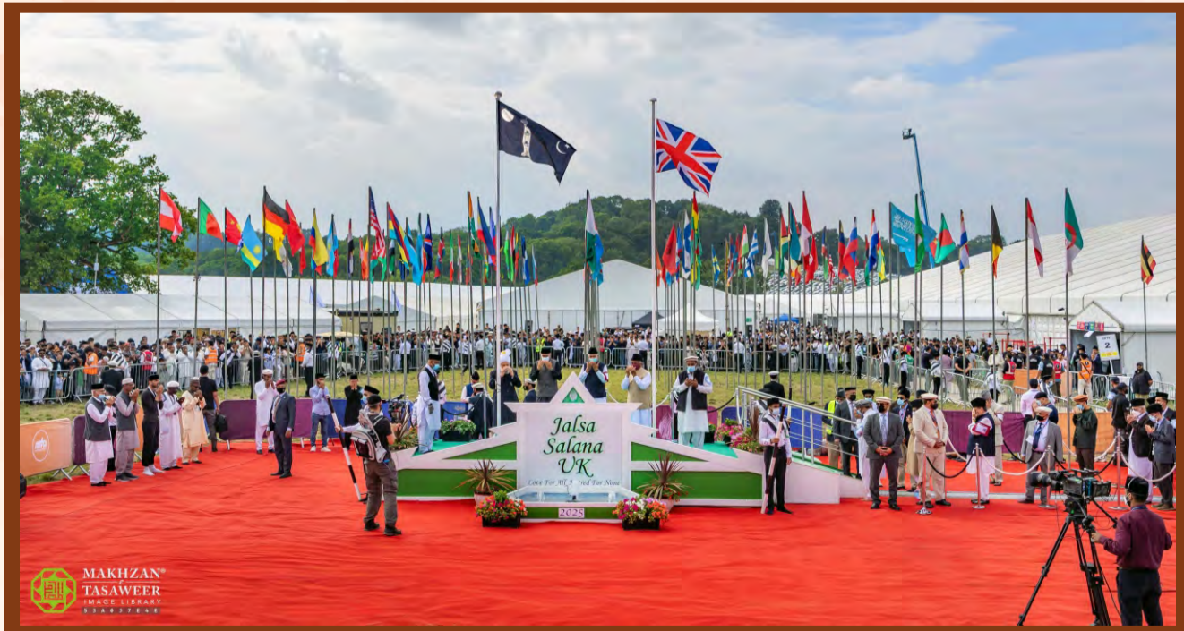
జల్సా సాలాన యు.కే 2025 కు చెందిన విశ్వాసభరిత దృశ్యాలు.