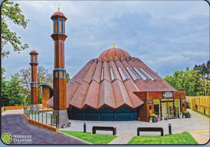
మస్జిద్ ముబారక్ (ఇస్లామాబాద్, యు.కే)