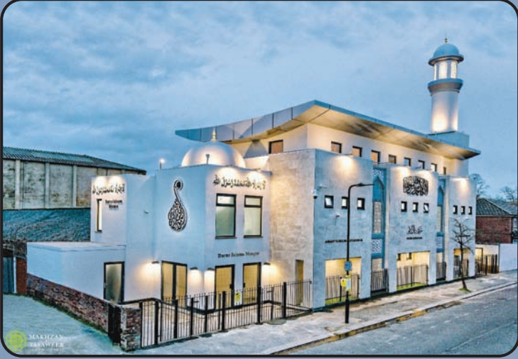
మస్జిద్ దారుస్సలాము (సౌత్ హాల్, యు.కే)