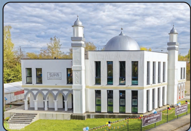
మస్జిద్ బైతుల్ హమీద్ (ఫిల్డా జర్మాని)

అంతర్జాతీయ అహ్మదియ్య జమాఅత్ నేడు ప్రపంచ 213 దేశాలలో స్థిరపడింది. అల్ హందులిల్లాహ్. ప్రపంచంలోని వివిధ దేశాలలో అహ్మదియ్య జమాఅత్ నిర్మించిన కొన్ని మస్జిద్ల అందమైన దృశ్యాలు.