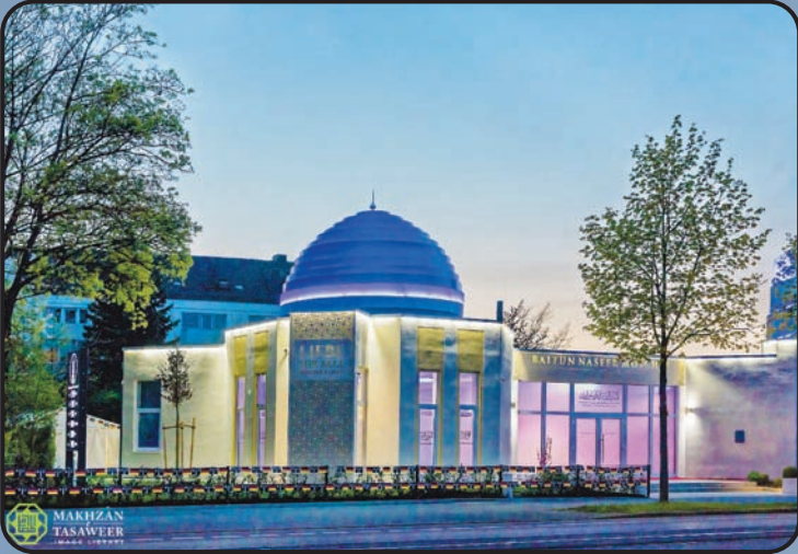
మస్జిద్ బైతున్నసీర్ (ఆగస్ బర్గ్, జర్మనీ)