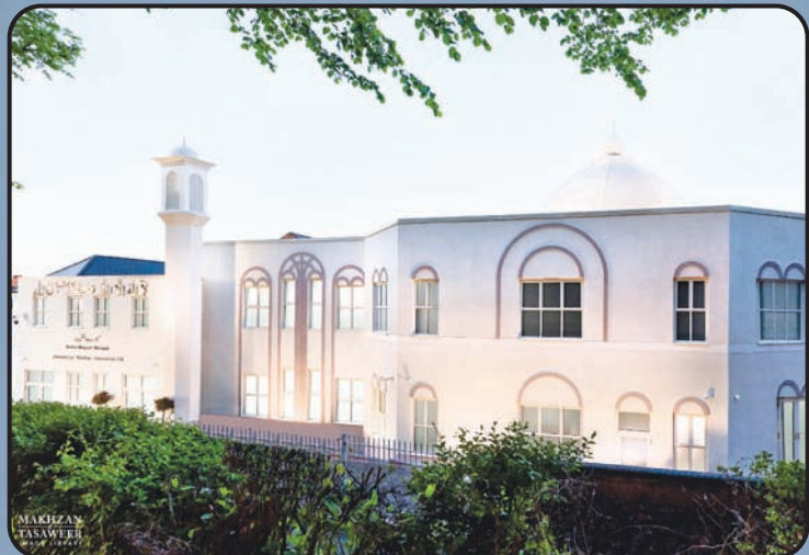
మస్జిద్ బైతుల్ ముఖీత్ (వస్సాల్, యు.కే)

అంతర్జాతీయ అహ్మదియ్య జమాఅత్ నేడు ప్రపంచ 213 దేశాలలో స్థిరపడింది. అల్ హందులిల్లాహ్. ప్రపంచంలోని వివిధ దేశాలలో అహ్మదియ్య జమాఅత్ నిర్మించిన కొన్ని మస్జిద్ల అందమైన దృశ్యాలు.