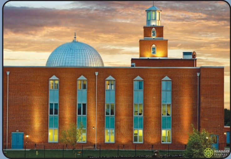
మస్జిద్ మహ్మూద్ (స్వీడన్)