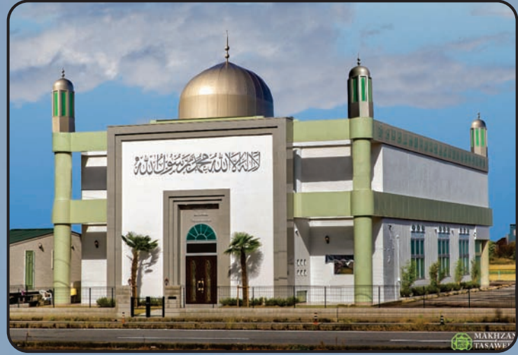
మస్జిద్ బైతుల్ అహద్ (నగోయా, జాపాన్)