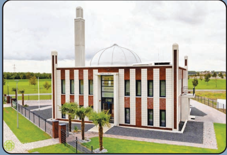
బైతుల్ ఆఫియత్ (అల్మేరే, హాలాండ్)