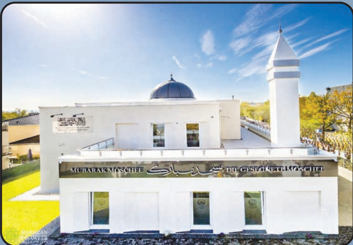
మస్జిద్ ముబారక్ (వేజ్ బాదాన్, జర్మనీ)