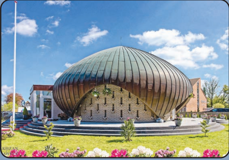
మస్జిద్ నుస్రత్ జహాఁ (కోపన్ హేగన్, డిన్యార్క్)