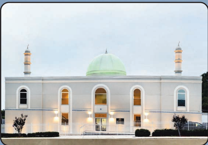
మస్జిద్ బైతుస్సమద్ (బాల్టిమోర్, అమెరికా)