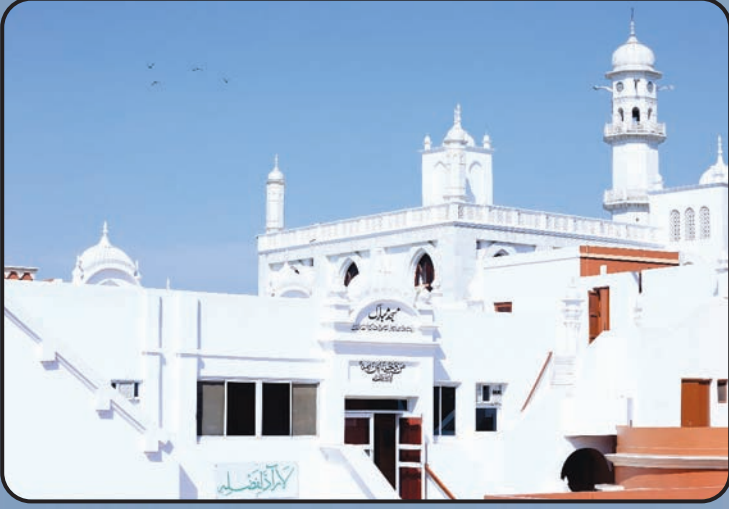
మస్జిద్ ముబారక్ (ఖాదియాన్)