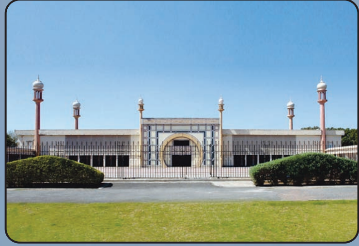
మస్జిద్ అఖ్సా (రబ్వా, పాకిస్తాన్)