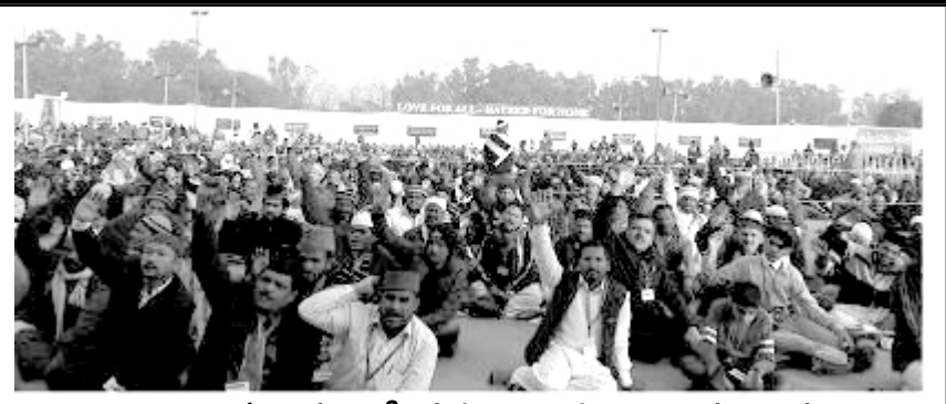
నినాదాలకు ఉత్సాహంతో సమాధానములు ఇస్తున్న సభికులు