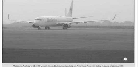
అల్లాహ్ తాలా ఇండోనేషియా జమాఅత్ సభ్యులకు చార్టర్డ్ విమానం ద్వారా జల్లా సాలాన ఖాదియాన్ లో పాల్గొనే అవకాశంను కల్పించుతూ, హజ్రత్ మసీహ్ మౌవూద్ అలైహిస్సలాంత్ చేసిన వాగ్దానమును ఎంతో వైభవముగా పూర్తి చేసినాడు. ఇదొక చాలిత్రాత్మక ఘట్టము. .

పుంజుకున్నది. జమాఅత్ సెంటర్లు నెలకొన్నవి, మస్జిద్లు నిర్మించ బడినవి. హెబామియోపతి డిప్లెస్టర్లు కూడ ఏర్పాటు చేయడం జరిగినది. ఒక మండల పరిషత్ పాఠశాలను కూడ ప్రారంభించడం జరుగినది. అంతేగాకా జల్లా సాలానాను కూడ ప్రారంభించడం జరిగినది. నేపాల్ భాషలో పవిత్ర ఖుర్ఆన్ అనువాదించ బడినది. జమాఅత్ లెట్రిచర్స్ కూడ ముద్రించడం జరుగుచున్నది. ఈ సంవత్సరము అల్లాహ్ తాలా కృప వలన 56 మంది అమ్మదీయులు ఖాదియాన్ జల్లాలో పాల్గొన్నారు.