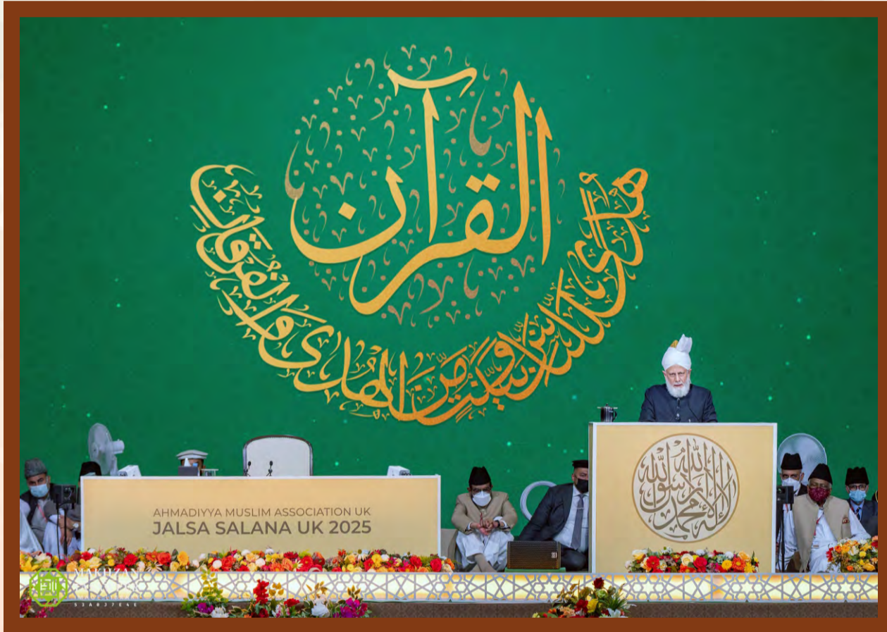
2025-ஆம் ஆண்டு பிரிட்டன் ஜல்ஸா ஸாலானா சந்தர்ப்பத்தில் ஹஸ்ரத் அமீருல் முஃமினீன் (அய்யதஹுல்லாஹ்) அவர்கள் சொற்பொழிவு நிகழ்த்திய காட்சி