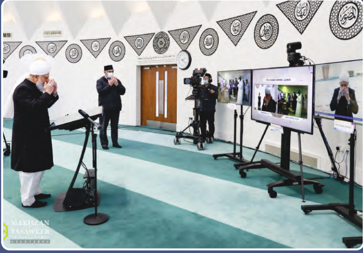
ஹஸ்ரத் ஐந்தாவது கல்ஃபத்துல் மஸ்ஹ் (அப்யதஹூல்லாஹ்) அவர்கள் 15 ஜனவரி 2021 அன்று MTA கானா என்ற புதிய சேனலை துவக்கி வைத்து துஆ செய்தவாறு