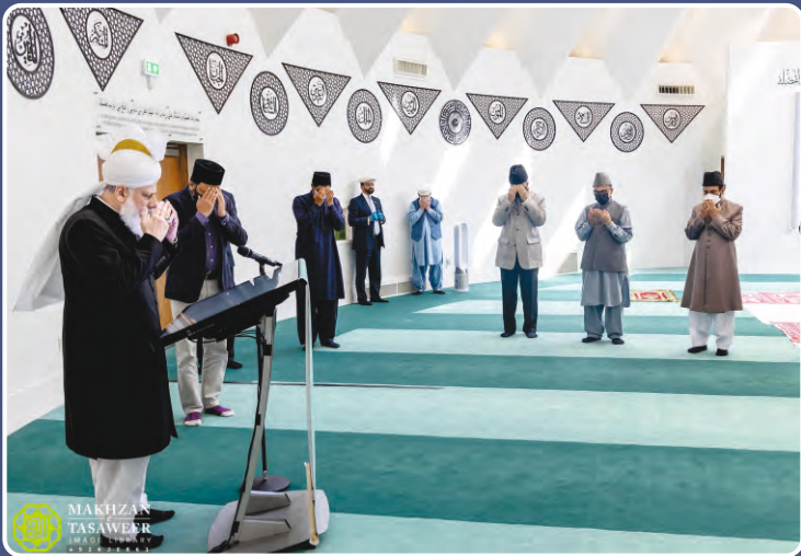
ஹுஸூர் அன்வர் (அப்யதஹூல்லாஹ்) அவர்கள் 02 ஜூலை 2021 அன்று Ahmadipedia என்ற வலைதளத்தை துவக்கி வைத்து துஆ செய்தவாறு