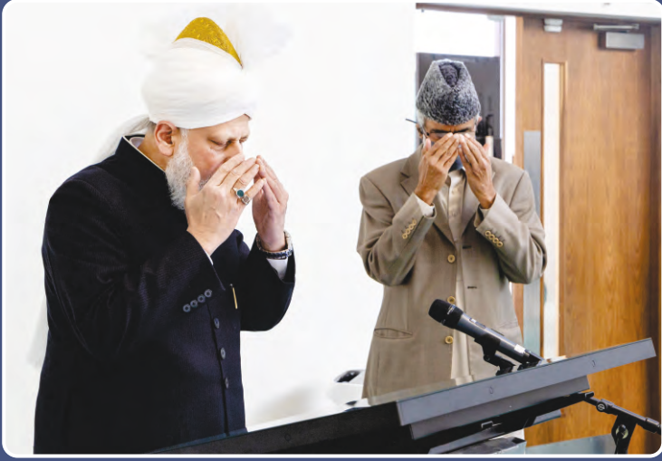
ஹஸ்ரத் ஐந்தாவது கல்ஃபத்துல் மஸ்ஹ் (அப்யதஹூல்லாஹ்) அவர்கள் 2 ஏப்ரல் 2021 அன்று சீன மொழியில் ஜமாஅத்தின் புதிய வலைதளத்தை துவக்கி வைத்து துஆ செய்தவாறு