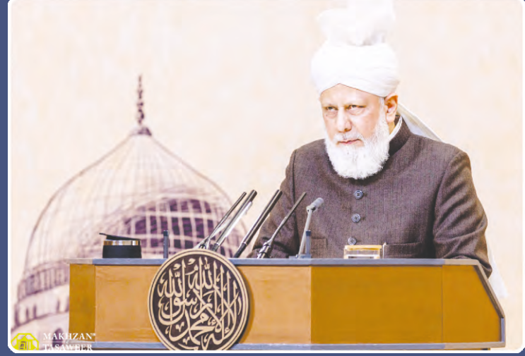
ஸய்யிதுனா ஹஸ்ரத் ஐந்தாவது கலீஃபத்துல் மஸீஹ் (அய்யதஹுல்லாஹ்) அவர்கள் காதியான் ஆண்டு மாநாடு 2021 சந்தர்ப்பத்தின்போது லண்டனிலிருந்து நிறைவுரை ஆற்றி துஆ செய்தவாறு