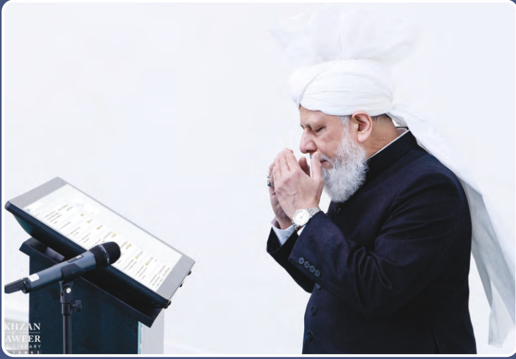
ஹஸ்ரத் ஐந்தாவது கல்ஃபத்துல் மஸ்ஹ் (அப்யதஹூல்லாஹ்) அவர்கள் 9 ஏப்ரல் 2021 அன்று திருக்குர்ஆன் வலைதளத்தை துவக்கி வைத்து துஆ செய்தவாறு