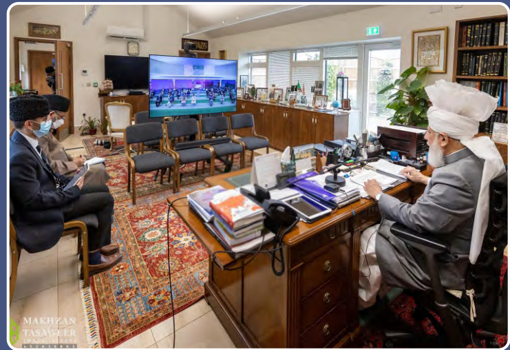
ஹுஸூர் அன்வர் (அப்யதஹூல்லாஹ்) அவர்கள் 27 ஜூன் 2021 அன்று MTA இன்டர்நேஷனல் Online மாநாட்டில் சொற்பொழிவு நிகழ்த்தியவாறு