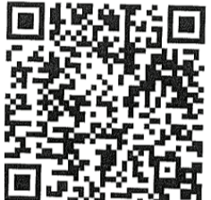
ଏମ୍.ଟି.ଏ ର ଅଫିସିୟାଲ୍ Whatsappp ଚ୍ୟାନେଲ୍