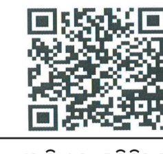
ଏମ୍.ଟି.ଏ ର ଅଫିସିୟାଲ୍ Youtube ଚ୍ୟାନେଲ୍

ରୁହାନୀ ଖଜାବନ୍ ଏବଂ ଅନ୍ଧାରୁଲ୍ ଉଲ୍ଲମର ସାମଗ୍ରିକ ସମୀକ୍ଷା ଏମ୍.ଟି.ଏ ଲଞ୍ଚରନ୍ୟାସନଲ୍ ଲଣ୍ଡିୟା ଷ୍ଟୁଡ଼ିଆ ପକ୍ଷରୁ "ପୁସ୍ତକ ପରିଚୟ" ଉପରେ ଆଧାରିତ ଏକ ନୂତନ ତଥ୍ୟଭିତ୍ତିକ ସିରିଜ୍ ଉପସ୍ଥାପିତ କରାଯାଉଅଛି । ଯହିଁରେ ରୁହାନୀ ଖଜାବନ୍, ଅନ୍ଧାରୁଲ୍ ଉଲ୍ଲମ ଗ୍ରନ୍ଥର ପୁସ୍ତକ ପରିଚୟ ଉପସ୍ଥାପିତ କରାଯାଇଥାଏ । ଏହି କାର୍ଯ୍ୟକ୍ରମଗୁଡ଼ିକ ମୁଖ୍ୟତଃ ଜମାଅତ୍ର ସଦସ୍ୟବୃନ୍ଦଙ୍କ ନିମନ୍ତେ ଜ୍ଞାନଭିତ୍ତିକ, ଆଧ୍ୟାତ୍ମିକ ଓ ସାଂସ୍କାରିକ ଦୃଷ୍ଟିରୁ ଅତ୍ୟନ୍ତ ଉପାଦେୟ ଅଟନ୍ତି । ଉଚ୍ଚ କାର୍ଯ୍ୟକ୍ରମ ସାହାଯ୍ୟରେ ପୁସ୍ତକଗୁଡ଼ିକୁ ବୁଝିବାରେ ବେଶ୍ ସହାୟକ ଏବଂ ପୁସ୍ତକ ଅଧ୍ୟୟନ କରିବା ପ୍ରତି ସଦସ୍ୟବୃନ୍ଦଙ୍କ ମଧ୍ୟରେ ଆଗ୍ରହ ତଥା ରୁଚି ସୃଷ୍ଟି ହୋଇଥାଏ । ତେଣୁ ଉଚ୍ଚ କାର୍ଯ୍ୟକ୍ରମ ବେଳେବେଳେ ଏମ୍.ଟି.ଏରେ ପ୍ରସାରଣ କରାଯାଇଥାଏ ଏବଂ ତତ୍ସହିତ ଏମ୍.ଟି.ଏ ଭାରତର ଯୁଦ୍ଧ୍ୟବ ଚ୍ୟାନେଲ୍ (MTA International India Studios)ରେ ମଧ୍ୟ ଏହି କାର୍ଯ୍ୟକ୍ରମ ଉପଲବ୍ଧ ରହିଛି । ତେଣୁ ଜମାଅତ୍ର ସଦସ୍ୟବୃନ୍ଦ ନିଜର ସୁବିଧା ଅନୁଯାୟୀ ଏହି କାର୍ଯ୍ୟକ୍ରମଗୁଡ଼ିକରୁ ଉପକୃତ ହୋଇପାରିବେ । ଏମ୍.ଟି.ଏର ଅଫିସିୟାଲ୍ ଯୁଦ୍ଧ୍ୟବ ଚ୍ୟାନେଲ୍କୁ ସବସ୍କ୍ରାଇବ କରନ୍ତୁ ଓ ହ୍ୱାଟସ୍ ଅପ୍ ଚ୍ୟାନେଲ୍କୁ ଫଲୋ କରନ୍ତୁ । କାରଣ ଆପଣମାନଙ୍କୁ ପ୍ରତ୍ୟେକ ନୂତନ କାର୍ଯ୍ୟକ୍ରମ ସଂପର୍କରେ ଯଥା ସମୟରେ ସୂଚନା ମିଳିପାରିବ ।