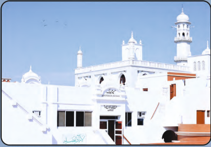
ମସଜିଦ ମୁବାରକ (କାଦିୟାନ)