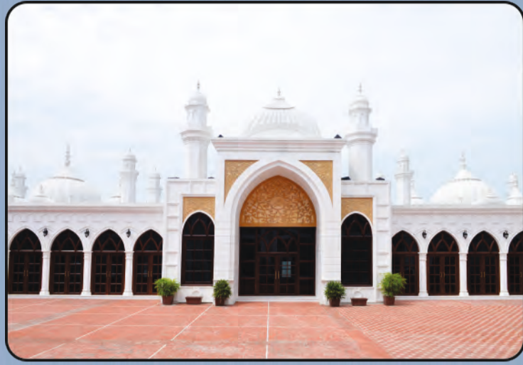
ମସଜିଦ ଅକ୍ସା (କାଦିୟାନ)