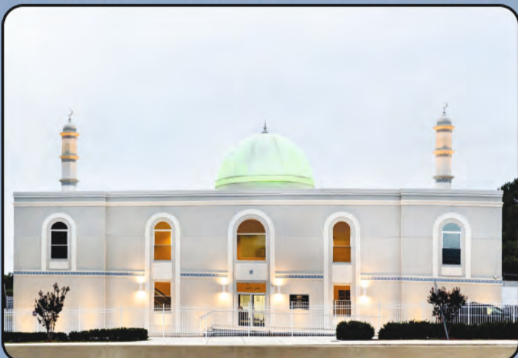
ମସଜିଦ୍ ବୈତୁସ୍ ସମଦ (ବାଲଟିମୋର, ଆମେରିକା)