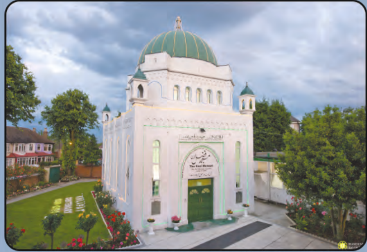
ମସଜିଦ୍ ଫଜଲ (ଲଣ୍ଡନ, ୟୁ.କେ)