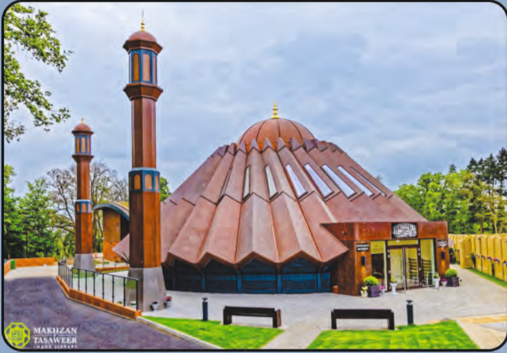
ମସଜିଦ୍ ନୁବାରକ (ଇସଲାମାବାଦ, ୟୁ.କେ)