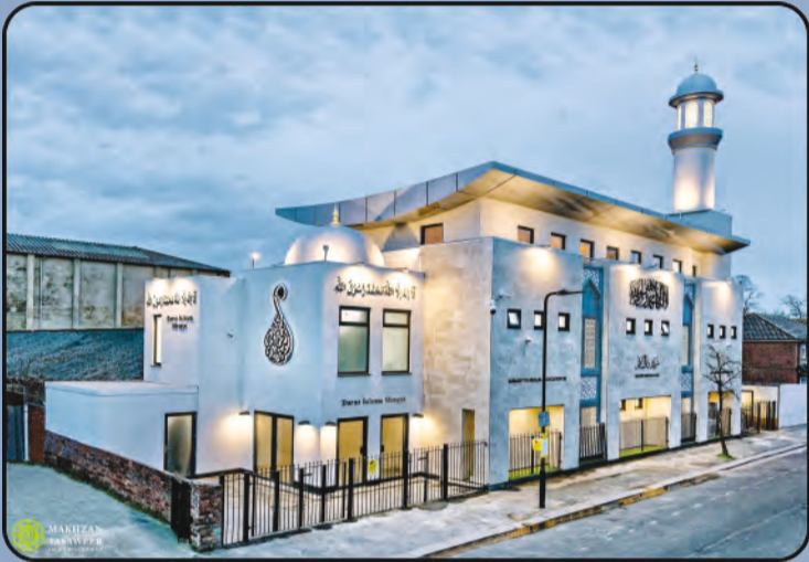
ମସଜିଦ ତାରୁସ୍ ସଲାମ (ସାଉଥ ହଲ, ୟୁ.କେ)