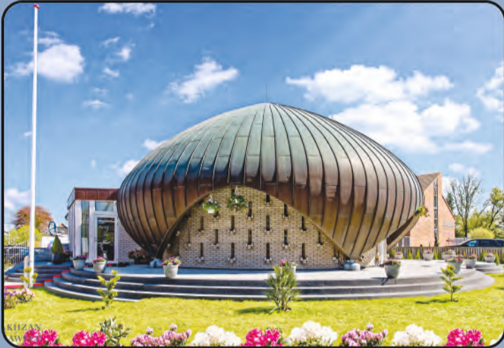
ମସଜିଦ୍ ନୁସରତ ଜାହାଁ (କୋପନହେଗେନ, ଡେନମାର୍କ)