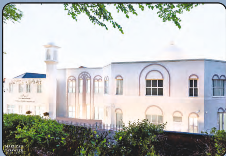
ମସଜିଦ ବୈତୁଲ୍ ମୁକୀତ୍ (ଫ୍ଲାଣ୍ଡାଲ, ୟୁ.କେ)

ବିଶ୍ୱବ୍ୟାପ୍ତ ଜମାଅତ ଅହମଦୀୟା ଆଜି ପୃଥିବୀର ୨୧୩ ଗୋଟି ଦେଶରେ ପ୍ରତିଷ୍ଠା ହୋଇସାରିଛି । ପୃଥିବୀର ବିଭିନ୍ନ ଦେଶମାନଙ୍କରେ ଜମାଅତ ଅହମଦୀୟା ତରଫରୁ ନିର୍ମିତ କେତେକ ମସଜିଦର ମନୋରମ ଦୃଶ୍ୟ