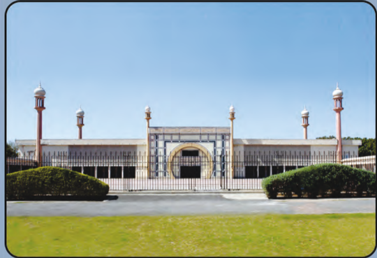
ମସଜିଦ୍ ଅକ୍ଷା (ରବୁଝା, ପାକିସ୍ତାନ)