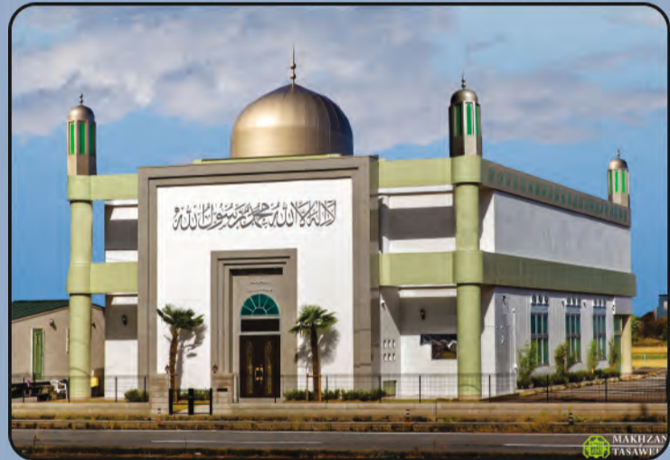
ମସଜିଦ୍ ବୈତୁଲ୍ ଅହ୍‌ଦ (ନିଗୋୟା, ଜାପାନ)