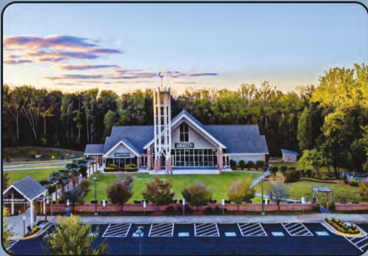
ମସଜିଦ୍ ମସରୁର (ଜାକ୍ସନଭିୟା, ଆମେରିକା)