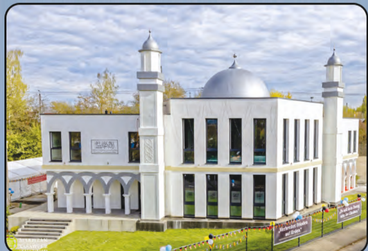
ମସଜିଦ୍ ବୈତୁଲ୍ ହମାଦ (ପୁଁଜା, ଜର୍ମାନୀ)

ବିଶ୍ୱବ୍ୟାପ୍ତ ଜମାଅତ ଅହମଦୀୟା ଆଜି ପୃଥିବୀର ୨୧୩ ଗୋଟି ଦେଶରେ ପ୍ରତିଷ୍ଠା ହୋଇସାରିଛି । ପୃଥିବୀର ବିଭିନ୍ନ ଦେଶମାନଙ୍କରେ ଜମାଅତ ଅହମଦୀୟା ତରଫରୁ ନିର୍ମିତ କେତେକ ମସଜିଦର ମନୋରମ ଦୃଶ୍ୟ