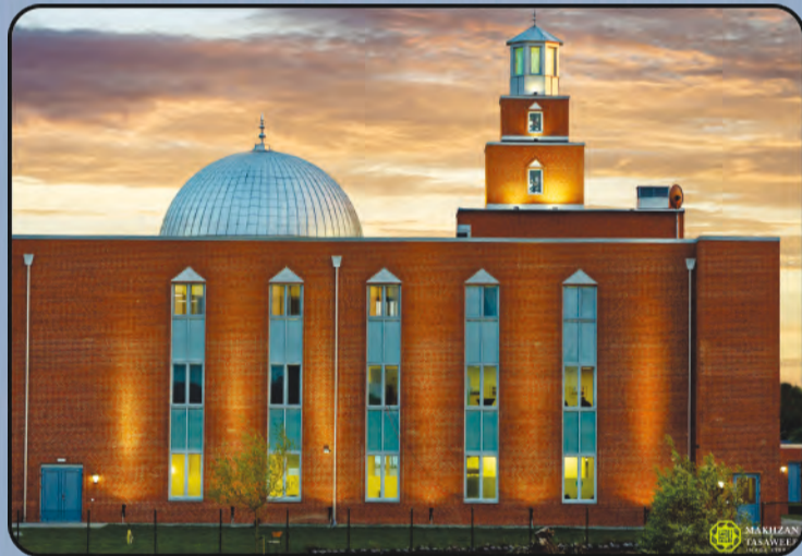
ମସଜିଦ ମହମୁଦ (ସ୍ୱିଡେନ)