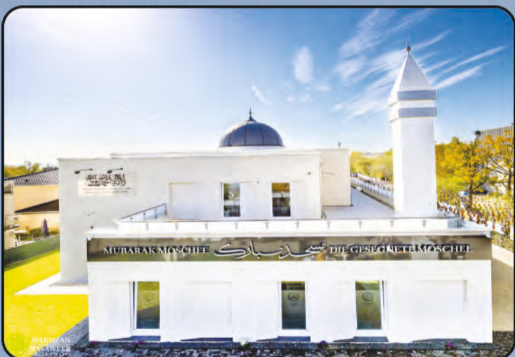
ମସଜିଦ ମୁବାରକ (ଓଜବାଦନ, ଜର୍ମାନୀ)