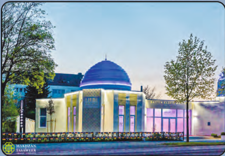
ମସଜିଦ ବୈତୁଲ ନସୀର (ଆଗସବର୍ଗ, ଜର୍ମାନୀ)