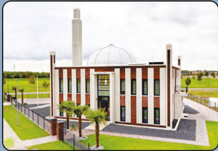
ବୈତୁଲ ଆଫିୟତ (ଅଲମେରେ, ହଲାଣ୍ଡ)