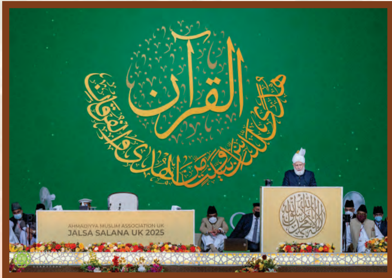
യു.കെ ജൽസാ സാലാന 2025 ൽ ഹുസൂർ തിരുമനസ്സ് പ്രഭാഷണം നിർവഹിക്കുന്നു