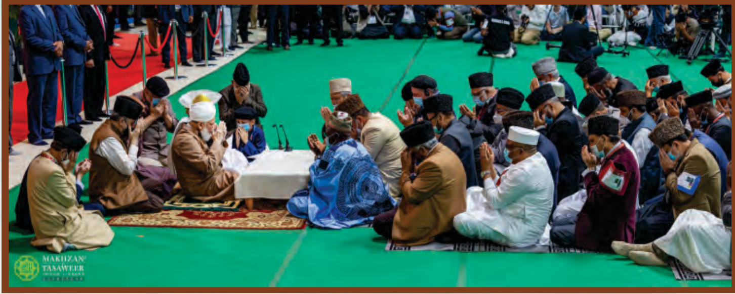
59-ാമത് യു.കെ ജൽസാ സാലാനയിലെ ആഗോള ബയ്അത്തിന്റെ വിശ്വാസവർദ്ധകമായ കാഴ്ച 111 രാഷ്ട്രങ്ങളിൽ നിന്നും 500 ജനവിഭാഗങ്ങളിലെ 2,44,408 വ്യക്തികൾ സ്നേഹത്തിന്റെ ചരടിൽ കോർത്തിണക്കപ്പെട്ടു.