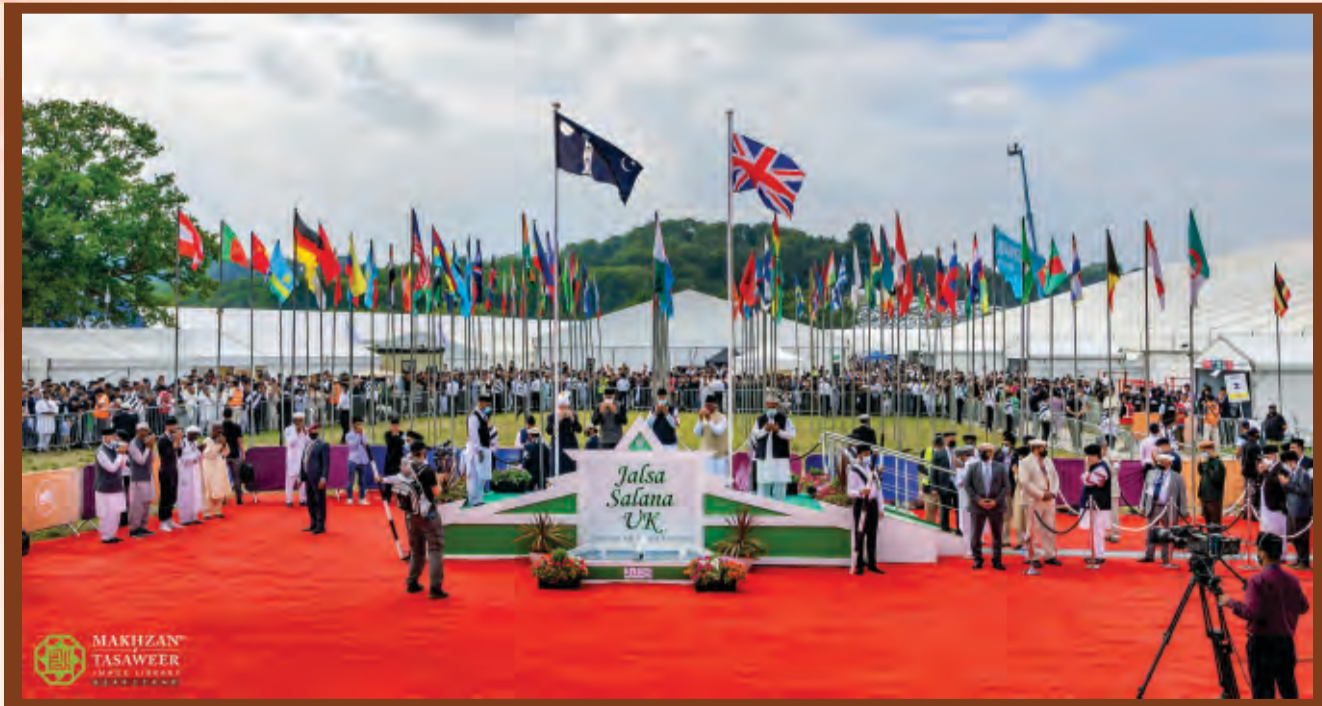
യു.കെ ജൽസാ സാലാന 2025 ലെ വിശ്വാസ വർദ്ധക ദൃശ്യം