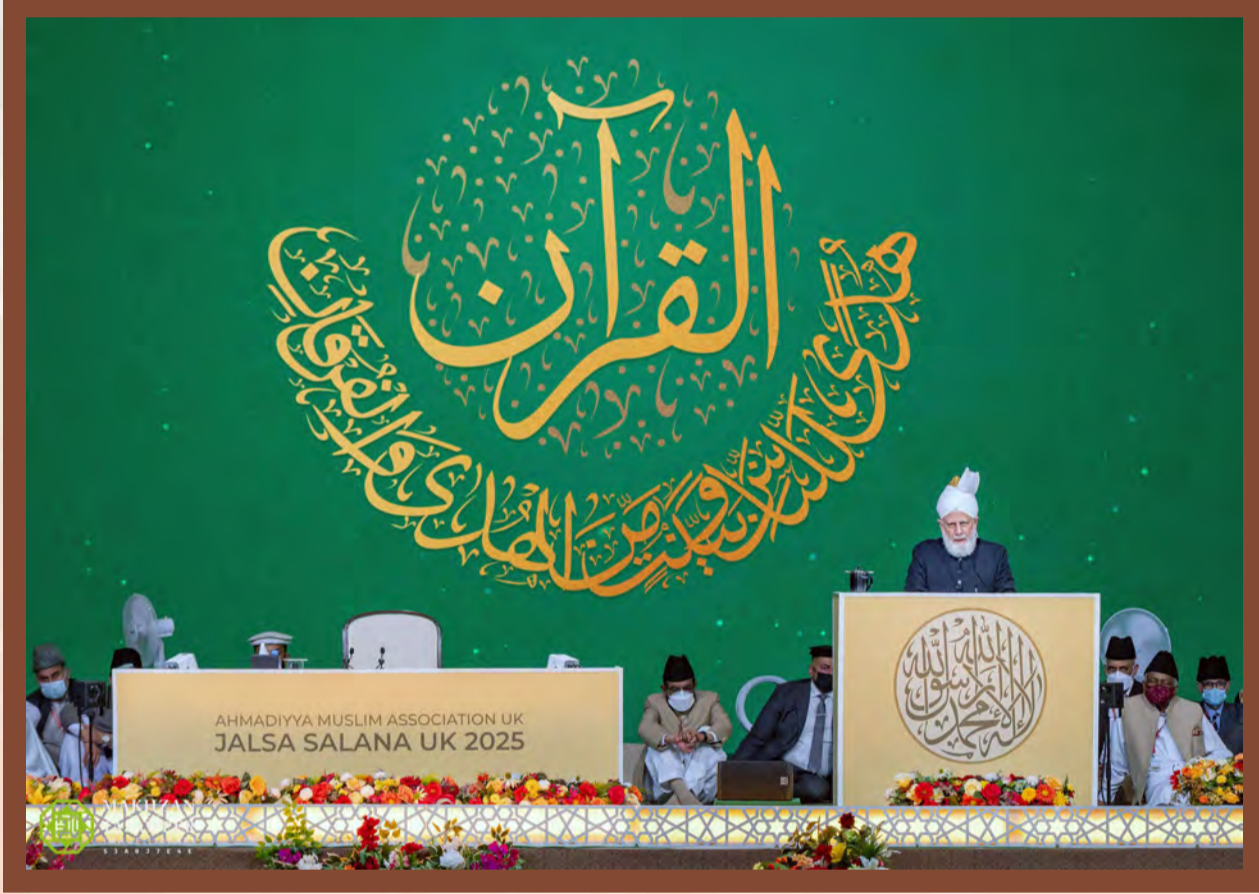
ಜಲ್ಲ ಸಾಲಾನ UK 2025ರ ಸಂದರ್ಭದಲ್ಲಿ ಹರ್ಯೂರತ್ ಅಮೀರಲ್ ಮುಮಿನೀನ್ (ರ.ಫ.ಓ.) ಸದಸ್ಯರನ್ನು ಸಂಬೋಧಿಸುತ್ತಿರುವ ದೃಶ್ಯ