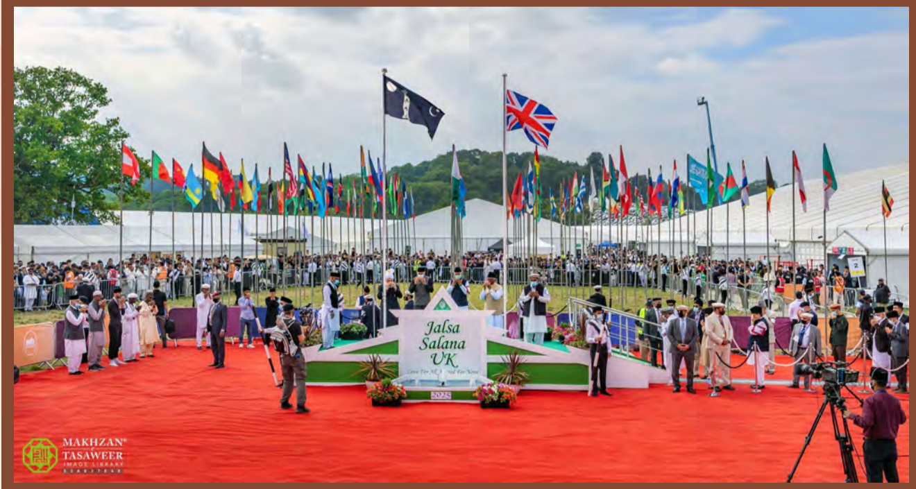
ಜಲ್ಲ ಸಾಲಾನ UK 2025ರ ಮನಮೋಹಕ ಮತ್ತು ಹೃದಯಸ್ಪರ್ಶಿ ದೃಶ್ಯ