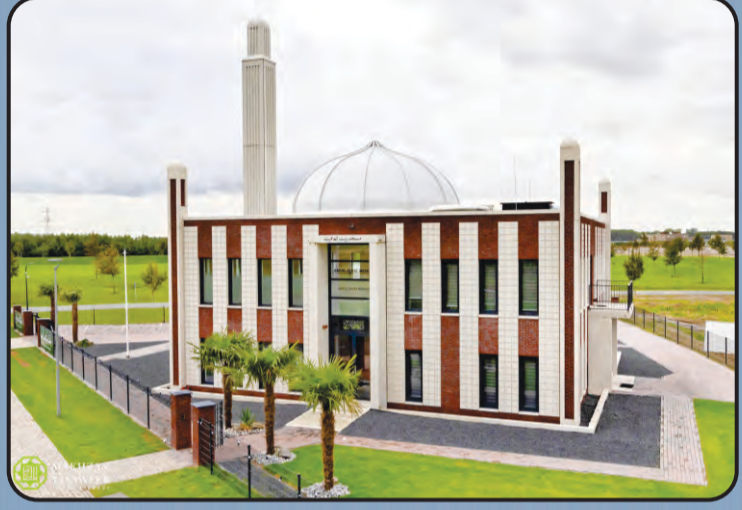
ಬೈತುಲ್ ಆಫಿಯತ್ (ಅಲ್‌ಮೇರೆ ಹಾಲೆಂಡ್)