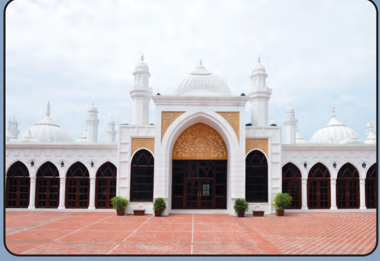
ಮಸ್ಜಿದ್ ಅಖ್ಲಿ (ಖಾದಿಯಾನ್)