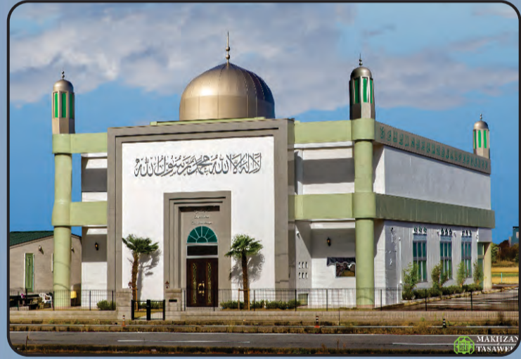
ಮಸ್ಜಿದ್ ಬೈತುಲ್ ಅಹದ್ (ನಗೋಯ, ಜಪಾನ್)