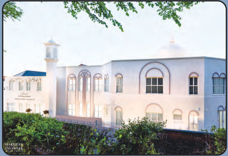
ಮಸ್ಜಿದ್ ಬೈತುಲ್ ಮುಖೀತ್ (ವಾಲ್ಸಾಲದ ಯು.ಕೆ)

ಜಾಗತಿಕ ಅಹ್ಮದಿಯಾ ಮುಸ್ಲಿಮ್ ಜಮಾಅತ್ ಈಗ 213 ರಾಷ್ಟ್ರಗಳಲ್ಲಿ ಸ್ಥಾಪನೆ ಆಗಿರುತ್ತದೆ. ಅಲ್‌ಹಮ್‌ದುಲಿಲ್ಲಾಹ್. ಲೋಕದಾದ್ಯಂತ ವಿವಿಧ ರಾಷ್ಟ್ರಗಳಲ್ಲಿ ಜಮಾಅತೆ ಅಹ್ಮದಿಯಾದ ವತಿಯಿಂದ ನಿರ್ಮಿಸಲಾದ ಕೆಲವು ಮಸೀದಿಗಳ ಸುಂದರ ನೋಟ