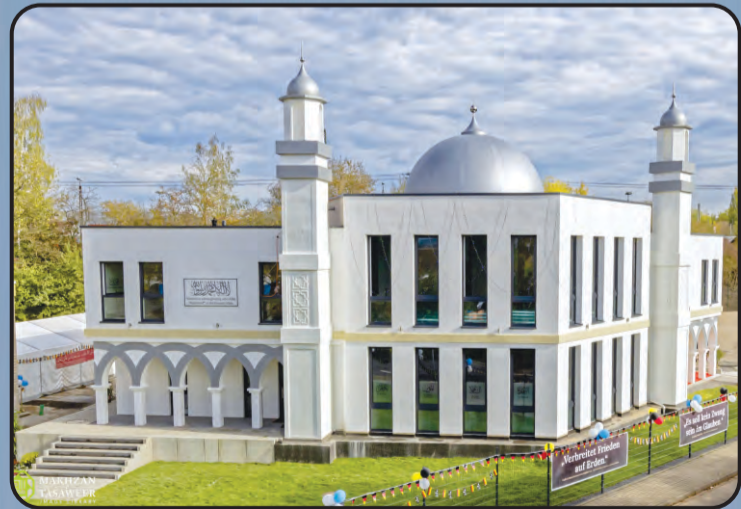
ಮಸ್ಜಿದ್ ಬೈತುಲ್ ಹಮೀದ್ (ಫಿಲ್ಡ್, ಜರ್ಮನಿ)

ಜಾಗತಿಕ ಅಹ್ಮದಿಯಾ ಮುಸ್ಲಿಮ್ ಜಮಾಅತ್ ಈಗ 213 ರಾಷ್ಟ್ರಗಳಲ್ಲಿ ಸ್ಥಾಪನೆ ಆಗಿರುತ್ತದೆ. ಅಲ್‌ಹಮ್‌ದುಲಿಲ್ಲಾಹ್. ಲೋಕದಾದ್ಯಂತ ವಿವಿಧ ರಾಷ್ಟ್ರಗಳಲ್ಲಿ ಜಮಾಅತೆ ಅಹ್ಮದಿಯಾದ ವತಿಯಿಂದ ನಿರ್ಮಿಸಲಾದ ಕೆಲವು ಮಸೀದಿಗಳ ಸುಂದರ ನೋಟ