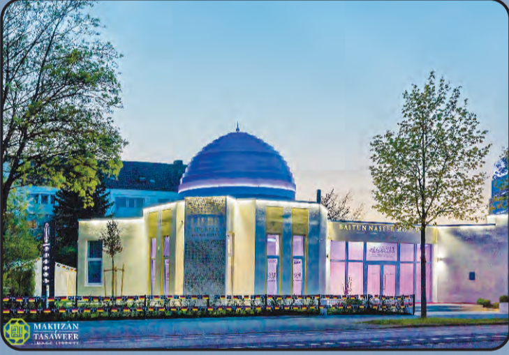
ಮಸ್ಜಿದ್ ಬೈತುನ್ನಸೀರ್ (ಆಗ್ಸ್‌ಬರ್ಗ್ ಜರ್ಮನಿ)