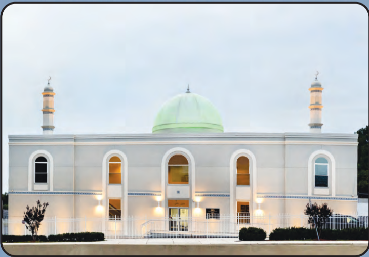
ಮಸ್ಜಿದ್ ಬೈತುಸ್ಸಮದ್ (ಬಾಲ್ವಿಮೂರ್, ಅಮೇರಿಕ)