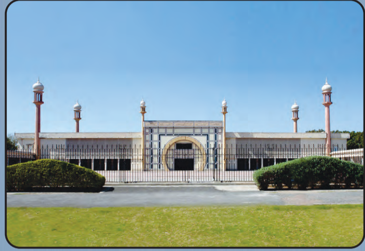
ಮಸ್ಜಿದ್ ಅಖ್ಲಿ (ರಬ್ಬಿ, ಪಾಕಿಸ್ತಾನ್)