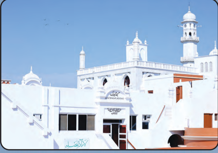
ಮಸ್ಜಿದ್ ಮುಬಾರಕ್ (ಖಾದಿಯಾನ್)