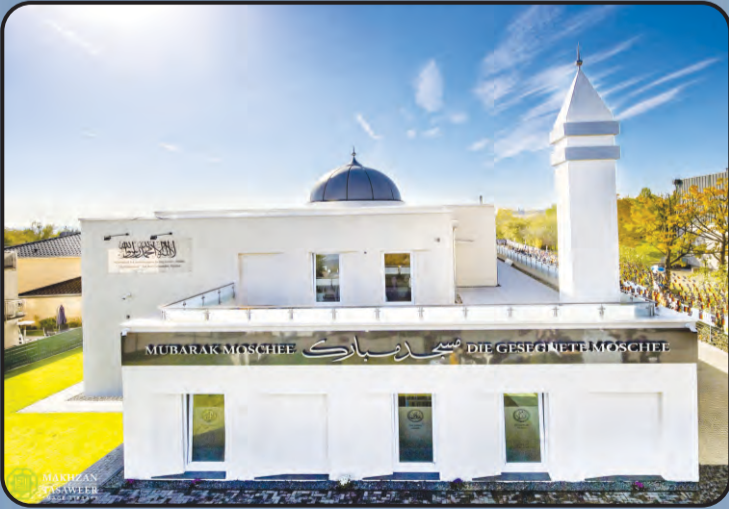
ಮಸ್ಜಿದ್ ಮುಬಾರಕ್ (ವೇಸ್ಪಾಡನ್, ಜರ್ಮನಿ)