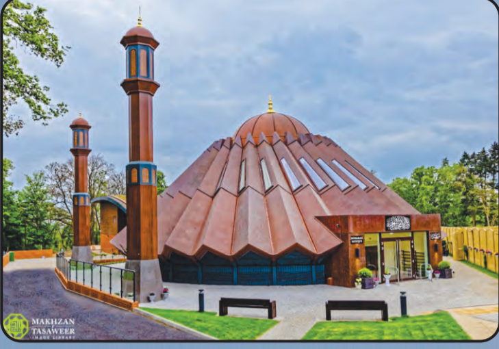
ಮಸ್ಜಿದ್ ಮುಬಾರಕ್ (ಇಸ್ಲಾಮಬಾದ್ ಯು.ಕೆ)