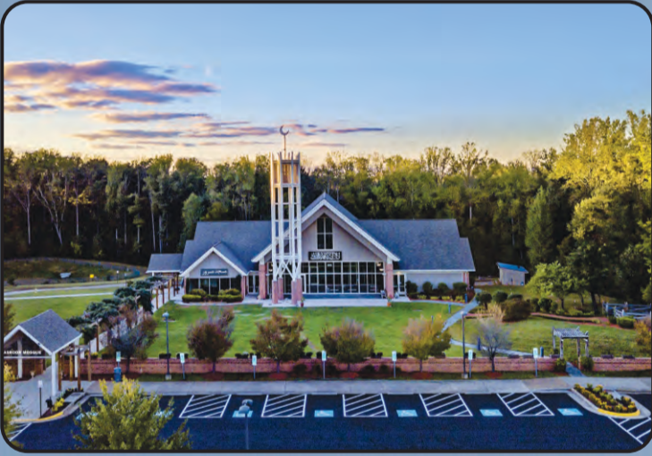
ಮಸ್ಜಿದ್ ಮಸ್ಜೂರ್ (ವರ್ಜೀನಿಯಾ ಅಮೇರಿಕ)