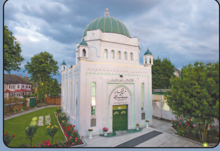
ಮಸ್ಜಿದ್ ಫಝಲ್ (ಲಂಡನ್ ಯು.ಕೆ)