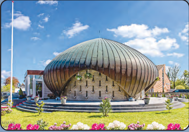
ಮಸ್ಜಿದ್ ನುಸ್ರುತ್ ಜಹಾನ್ (ಕೂಪನ್ ಹೇಗನ್, ಡೆನ್ಮಾರ್ಕ್)