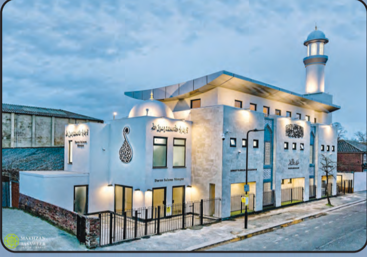
ಮಸ್ಜಿದ್ ದಾರುಸ್ಸಲಾಮ್ (ಸೌಥ್‌ಹಾಲ್, ಯು.ಕೆ)