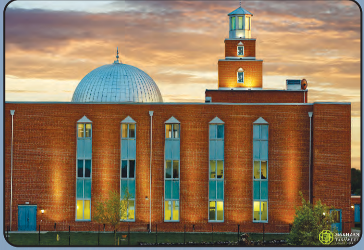
ಮಸ್ಜಿದ್ ಮಹ್ಮೂದ್ (ಸ್ವೀಡನ್)