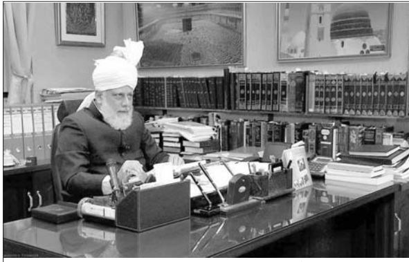
حضرت امیر المؤمنین خلیفۃ المسیح الخامس ایدہ اللہ تعالیٰ بنصرہ العزیز عربی زبان میں پیغام عطا فرما رہے ہیں

پس یہ کوئی معمولی کام نہیں ہے جو اس زمانے میں اللہ تعالیٰ نے مسیح موعود اور مہدی معبود کے ماننے کے بعد ہمارے ذمہ لگا دیا ہے۔