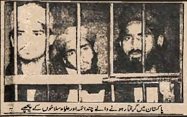
قریب افراد کو گرفتار بھی کیا گیا تھا۔ پاکستانی صدر پرویز مشرف نے انتہا پسندی سے نمٹنے کا

قانونی ہے۔ ڈپٹی انسپکٹر جنرل پولیس ملتان ملک اقبال نے کہا ہے کہ متعدد افراد کے خلاف صرف اس لئے مقدمات درج ہوئے ہیں کہ انہوں نے عربی کے علاوہ اردو پنجابی اور سرانسیکی زبان میں تقاریر کی تھیں۔ پنجاب کے مختلف شہروں میں کتابوں کی دکانوں پر بھی چھاپے مارے گئے۔ پنجاب پولیس کے ترجمان کے مطابق فیمل آباد میں 6 اور لاہور میں 3 افراد کو گرفتار کیا گیا ان پر الزام ہے کہ ان کے قبضے سے 300 کے قریب قابل اعتراض آڈیو کیسٹس 100 سے زائد سی ڈیز اور ہزاروں کی تعداد میں ایسی کتب پمفلٹ اور ہینڈ بل برآمد ہوئیں جو پولیس کے بقول قانون کی نظر میں قابل اعتراض ہیں۔